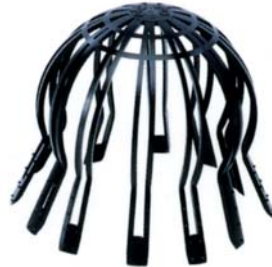
Paragravillas universal de polietileno