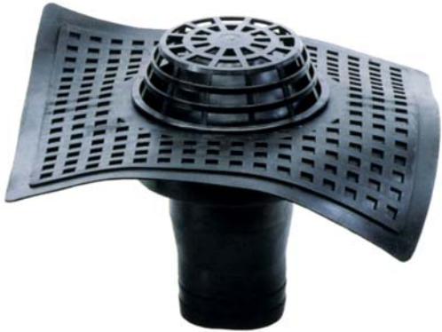
Cazoletas de desagüe fabricadas en goma EPDM con paragravillas