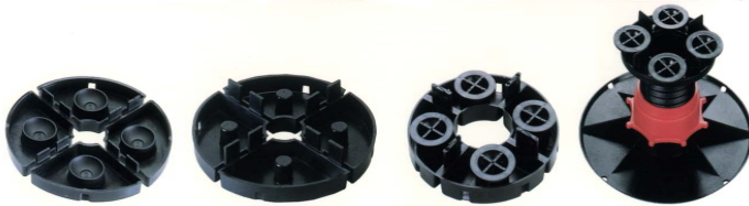
Soportes de altura fija con discos niveladores y soportes regulables mediante llave para AISLALOSA