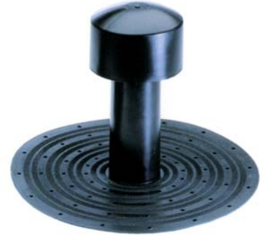
Chimeneas de ventilación de TPE